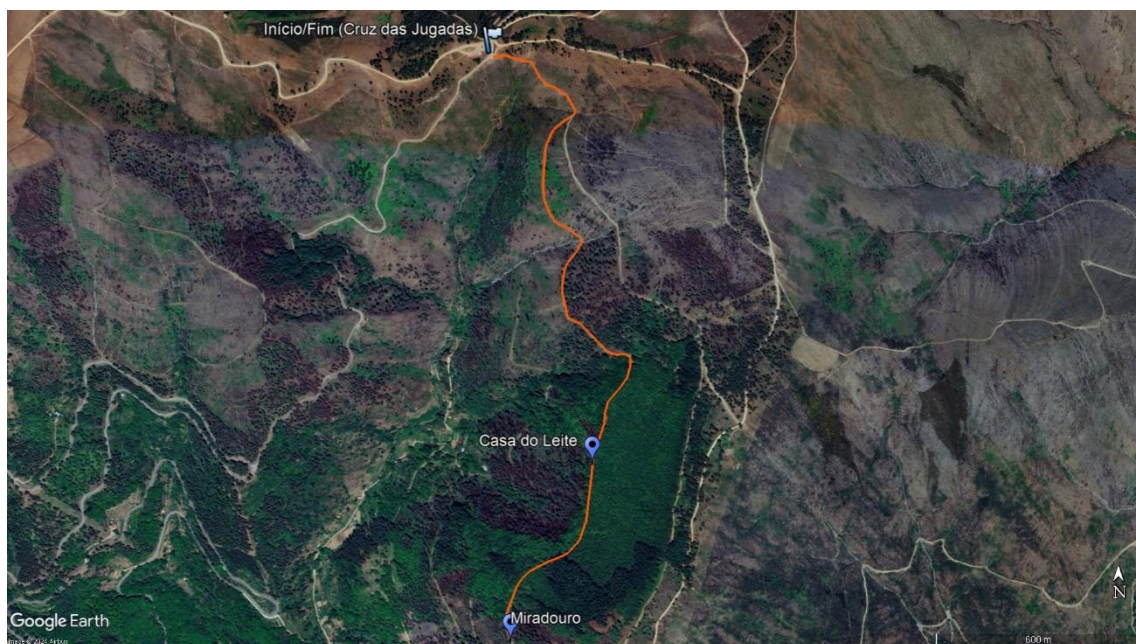
Figure 2 - Percurso proposto para a Caminhada Familiar

Material necessário: Roupa (mediante a previsão meteorológica: impermeável), calçado confortável, água e reforço alimentar.