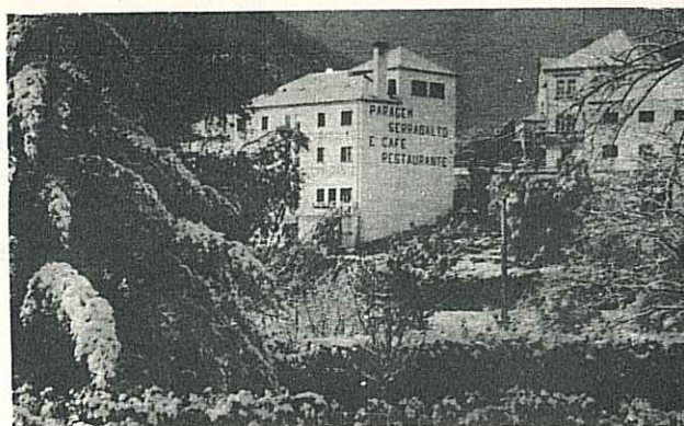
MANTEIGAS - Paragem Serradalto