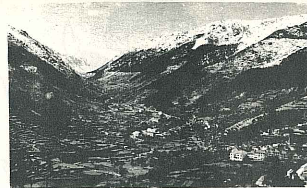
MANTEIGAS - Coração da Serra da Estrela