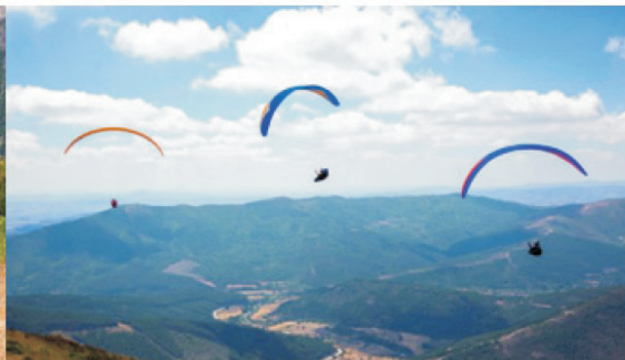
> A tradição do parapente em Manteigas é antiga. O concelho possui dois dos melhores locais do país para a prática da modalidade.