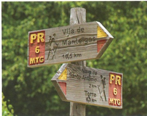
Trilhos Verdes em Manteigas ▲