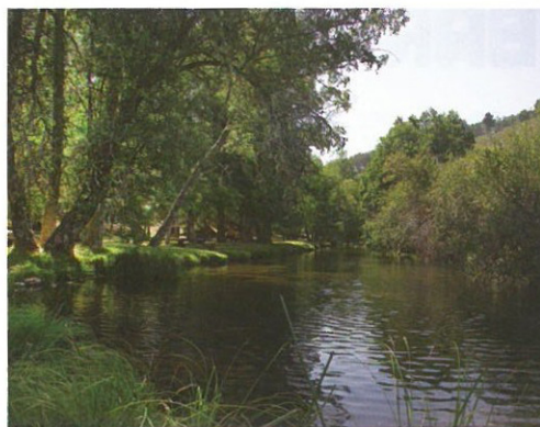
Covão da Ponte ▲