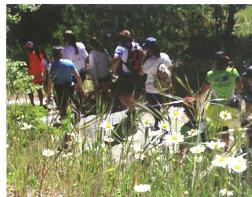
Trilhos Verdes em Manteigas ▲