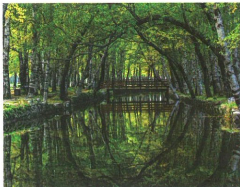
Covão d'Ametade ▲

Ao percorrer a Rota do Poço do Inferno verifica-se um dualismo de paisagem, natural e humanizada, marcada pelo diferente tipo de vegetação, com florestas de folhosas e resinosas, onde os sentidos despertam diferentes emoções ao longo do trilho.