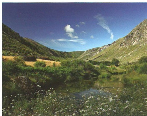
Vale Glaciário do Zêzere/Por Miguel Serra ▲