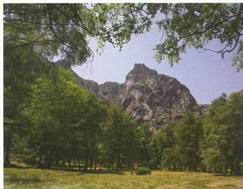
Covão d'Ametade ▲

O complexo da Relva da Reboleira, localizado na Freguesia de Sameiro, a 8 km da sede de Concelho, inclui um conjunto de infraestruturas de apoio aos visitantes. Na época do Verão, a praia fluvial e o parque de campismo fazem as delícias dos turistas que aproveitam as águas límpidas do Rio Zêzere e a sombra refrescante das árvores autóctones do local. Um espaço ideal para um contacto pleno com a natureza, de fácil acesso e com estacionamento gratuito próximo da zona balnear.