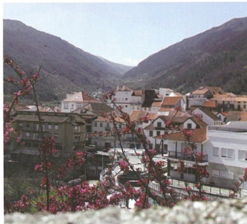
Vila de Manteigas ▲

Um posto de visita e venda ao público das trutas produzidas na truticultura da Fonte Santa, que se instalou naquele espaço, aproveitado as águas cristalinas e bravas do Zêzere que irrompem da serra.