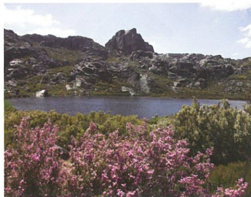
Lagoa do Peixão ▲

Local situado a 1.475 metros de altitude, que noutros tempos era escolhido para tratamentos, de doenças pulmonares, e é ainda hoje, lugar privilegiado e predileto dos que pretendem gozar momentos de tranquilidade.