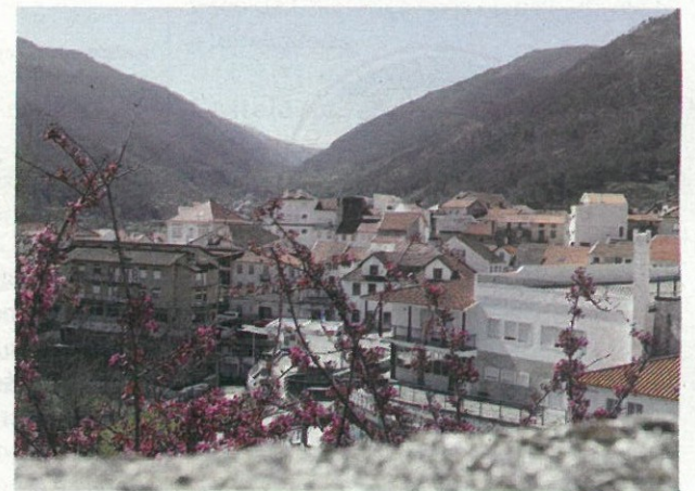
Vila de Manteigas

https://cm-manteigas.pt/ http://civglaz-manteigas.pt/ http://manteigastrilhosverdes.com/