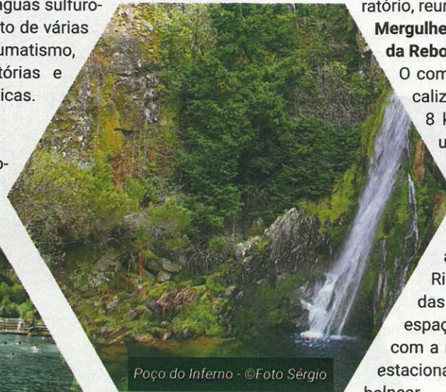
Poço do Inferno

Inseridas na Região Hidrotermal de Montanha, a