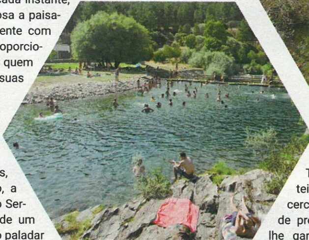
Relva da Reboleira

Deguste os enchidos regionais, como a morcela, o farinheiro, a chouriça, o presunto e o queijo Serra da Estrela, acompanhado de um vinho da Beira Interior. Adoce o paladar com um pastel de feijoca - pastel feito artesanalmente somente com ovos, feijoca de Manteigas, farinha e açúcar.