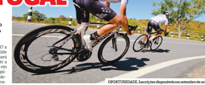
OPORTUNIDADE. Inscrições disponíveis em setembro de 2016

A Ultra Spirit Sports lança um novo desafio, ao organizar um evento por etapas, tendo como cenário a EN2